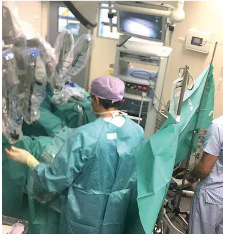
La mise en place du robot à la clinique de l'Yvette.

bénéfice du patient. À l'aide des joysticks, le robot retranscrit parfaitement chaque mouvement de mes mains, de la console vers les bras équipés de pinces articulées et miniaturisées. Des mouvements qui peuvent se faire sur 360°. Je peux zoomer, reculer, me déplacer, avec un champ de vision en 3D, ce qui est particulièrement intéressant pour la préservation nerveuse dans la chirurgie de la prostate. Les minuscules incisions de l'opération signifient moins de saignements et une récupération plus rapide pour le patient. »